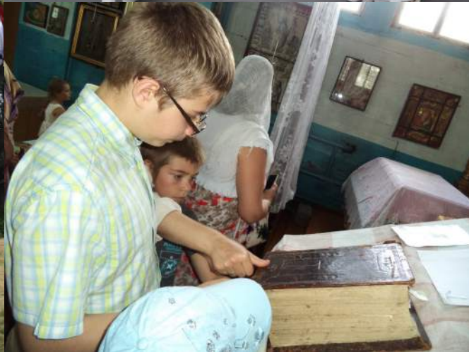
Над выпуском работали: Главный редактор– настоятель храма митрофорный протоиерей Павел Самойленко; Пономарева А.М., Безрукова И.Н.